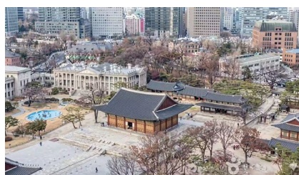
德寿宫 (在德寿宫里享用咖啡) (每人1杯美式咖啡)

酒店: 首尔万枫酒店/ Mercure Ambassador Seoul Magok酒店 或同级