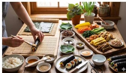
紫菜博物馆 (DIY紫菜包饭)