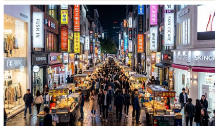
明洞 + 免税店