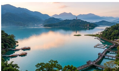
日月潭 (含游船) + 文武庙观景台

为邵族的祖居地, 因潭形状似日, 月而得名. 早年更以「双潭秋月」名列台湾八景之一, 且于国际间素享盛名.