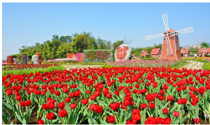
台中中社花海 (含门票)