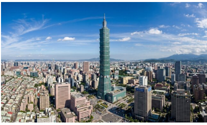
台北101大楼 (自费登观景台)