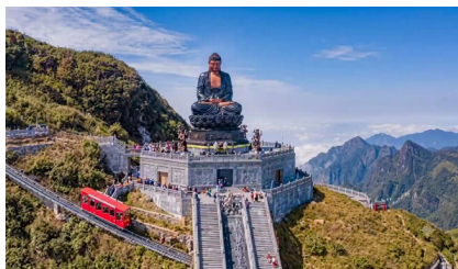
番西邦峰 (含双程缆车 + 单程登顶小火车)

** 若缆车维修, 将由其他景点替代* 是越南内黄连山脉的主峰, 位于老街省境内, 西北距著名旅游胜地沙坝市社9公里, 海拔3,143公尺, 是法属印度支那(越南, 寮国与柬埔寨)最高峰.