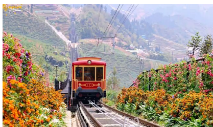
芒花站火车站上番西邦峰缆车站(单程)