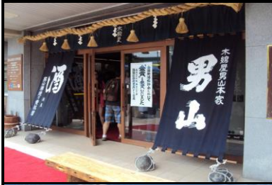
男山造酒厂 品尝日式清酒