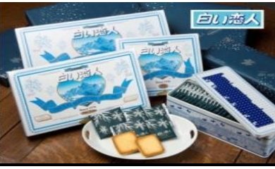
白色恋人巧克力工厂 (含入内参观门票)