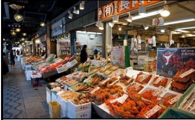
【札幌海鲜市场：二条市场】

第 6 天 札幌：海鲜市场-二条市场～市区观光～白色恋人巧克力工厂～Outlet～狸小路商店街