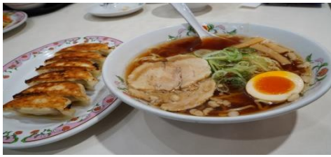
北海道拉面套餐 Hokkaido Ramen Set meal