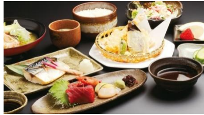
日式风味餐 Japanese Cuisine