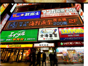
札幌 susukino 薄野: 百货公司、地下街

晚上前往 susukino 薄野欢乐街 , 在这里约有 4000 家的小吃店、小酒店闻名全日本, 不夜城内的拉面横町(拉面街), 可做为晚上夜游的好去处。