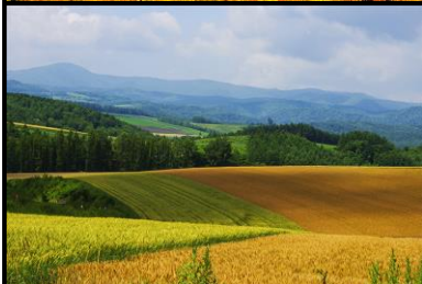
美瑛丘陵. 拼布之路

搭乘层云峡温泉街的高空缆车到大雪山群峰的黑岳, 瞭望壮阔的景色。自标高1300公尺可看到360度的全景。 【★枫叶期大约 9月20日至10月20日之间, 视天气状况】