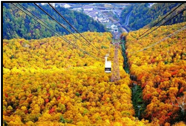
大雪山黑岳丘, 搭乘缆车

搭乘层云峡温泉街的高空缆车到大雪山群峰的黑岳, 瞭望壮阔的景色。自标高1300公尺可看到360度的全景。 【★枫叶期大约 9月20日至10月20日之间, 视天气状况】