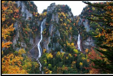
层云峡 银河.流星夫妻瀑布

【★枫叶期大约 9月20日至10月20日之间, 视天气状况】 流星瀑布从90公尺高的断崖上一口气俯冲倾泻而下, 轰隆的水声夹带无数的水花, 宛如千军万马奔腾一般, 声势慑人。它的左边是落差120公尺的银河瀑布, 像拉着银丝般的水流姿态, 显得柔和而美丽。有人说流星瀑布是雄瀑布, 而银河瀑布是雌瀑布, 把这两座瀑布合称为夫妻瀑布, 名列日本百选瀑布之中。