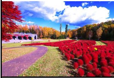
【國營瀧野玲蘭丘陵公園】的掃帚草 (Kokia)